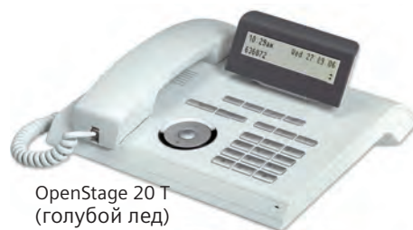
OpenStage 20 T (голубой лед)