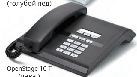
OpenStage 10 T (лава.)