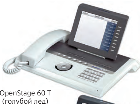
OpenStage 60 T (голубой лед)