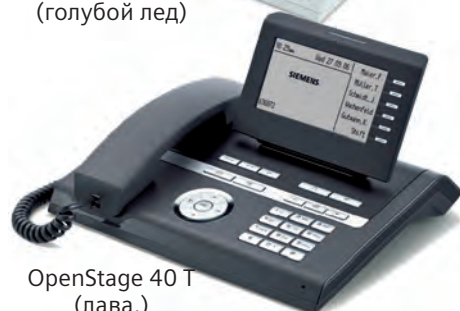
OpenStage 40 T (лава.)