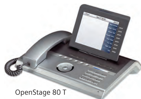
OpenStage 80 T