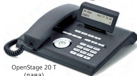
OpenStage 20 T (лава)