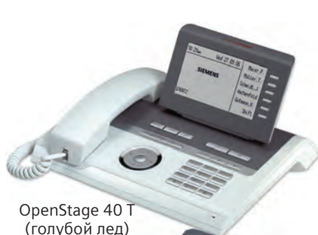
OpenStage 40 T (голубой лед)