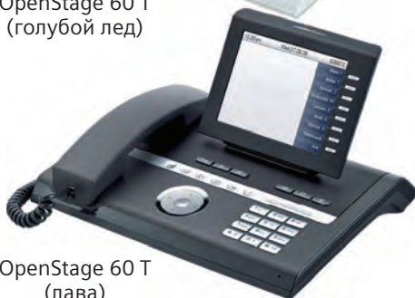
OpenStage 60 T (лава)