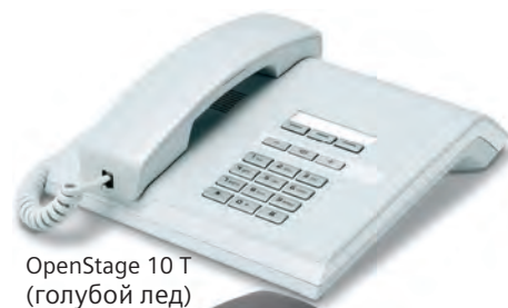
OpenStage 10 T (голубой лед)